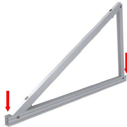
Triángulo abierto premontado. Fijación al suelo a 90°.