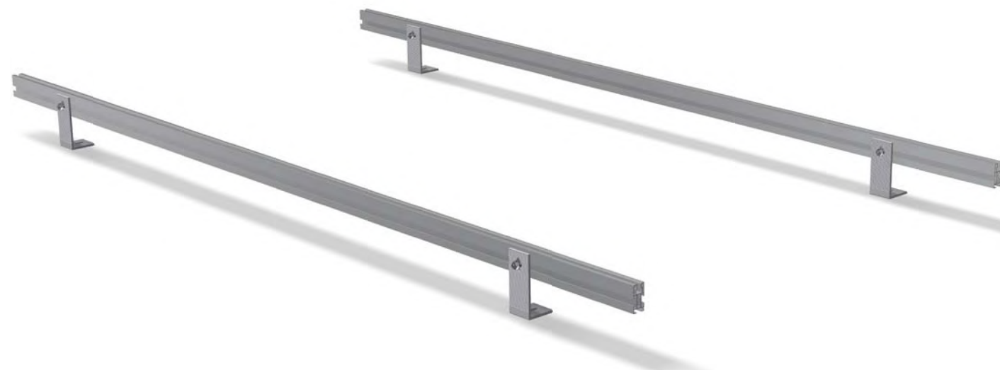
Estructura formada por perfiles RCVE 4.0 y fijación L120