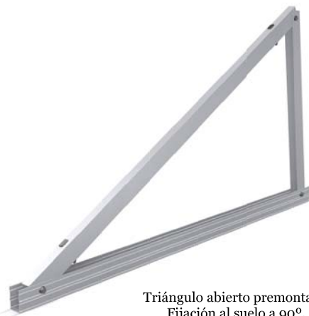
Triángulo abierto premontado. Fijación al suelo a 90°.