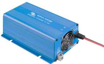
Phoenix Inverter 12/180