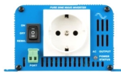
Phoenix Inverter 12/180 with Schuko socket