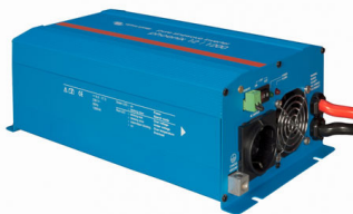
Phoenix Inverter 12/800 with Schuko socket

Para los modelos de menor potencia recomendamos el uso de nuestro conmutador de transferencia automático "Filax". El tiempo de conmutación del "Filax" es muy corto (menos de 20 milisegundos), de manera que los ordenadores y demás equipos electrónicos continuarán funcionando sin interrupción.