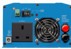
Phoenix Inverter 12/800 with BS 1363 socket