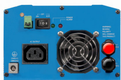
Phoenix Inverter 12/800 with IEC-320 socket