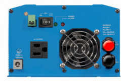
Phoenix Inverter 12/800 with Nema 5-15R socket